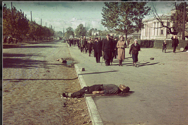
Автор фото – німецький військовий фотограф Йоганнес Геле, Київ, 1941